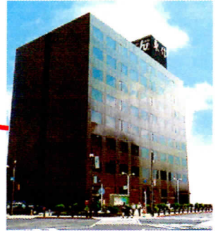
東濃信用金庫 本店